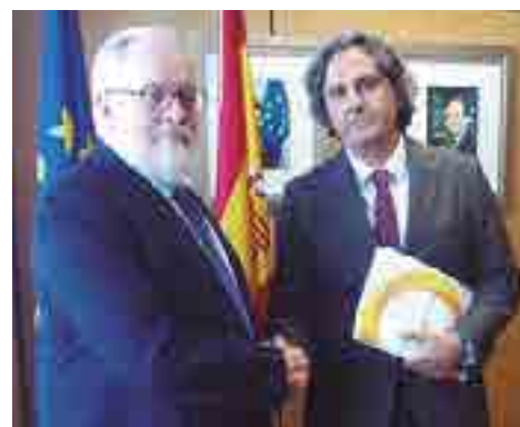
Reunión con Miguel Arias Cañete.