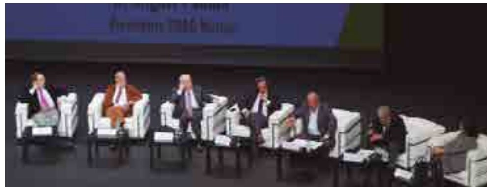
Acto de clausura del Camino del Sol 2017, Murcia.