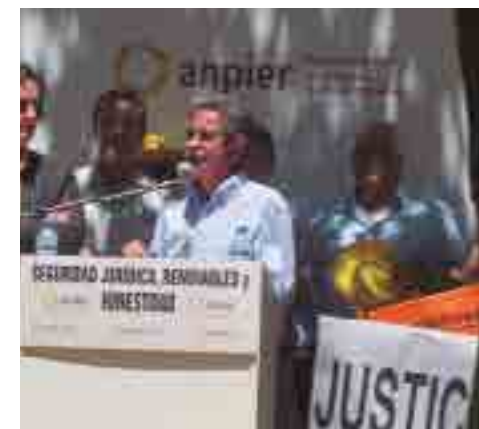
Miguel Ángel Revilla en un acto de Anpier.