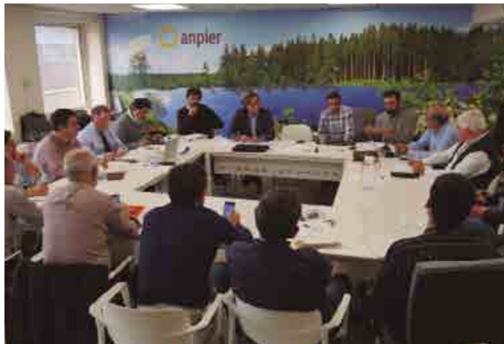
Reunión de la Junta Directiva de Anpier.

Los socios de ANPIER pueden disfrutar de numerosos servicios de forma gratuita.