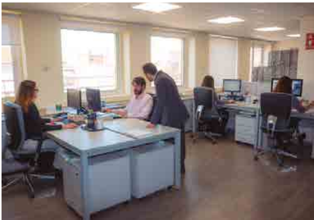
Oficinas de Anpier en Madrid.

Empresa para las inspecciones termográficas aéreas de plantas fotovoltaicas.